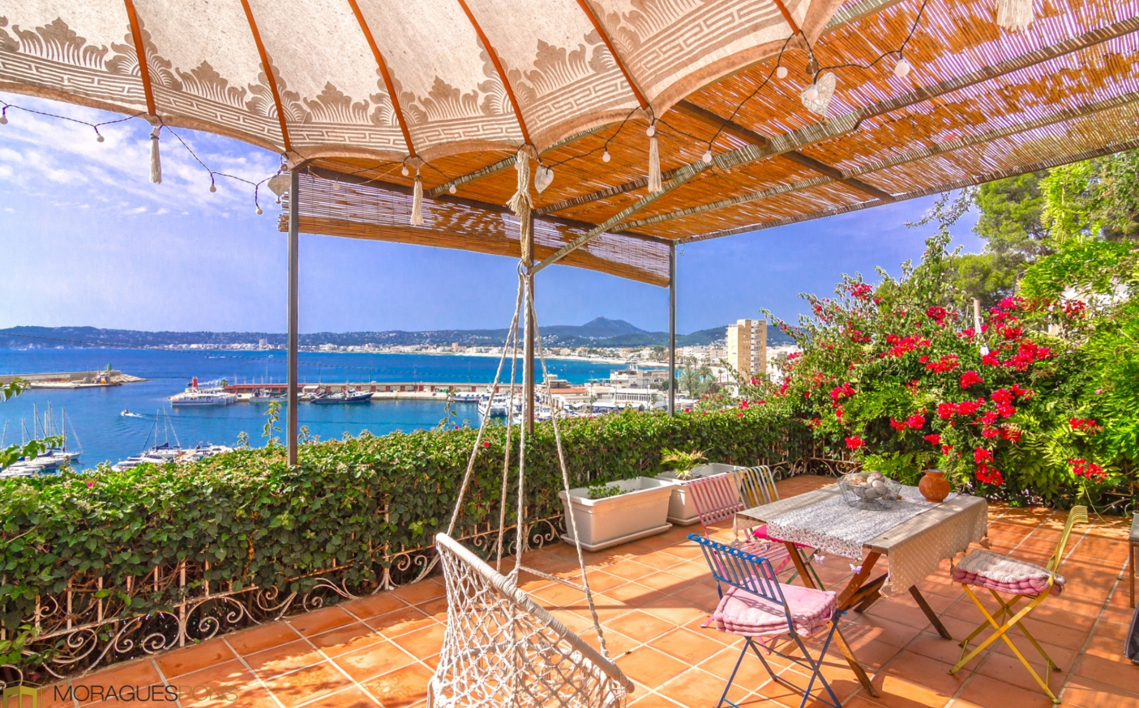
Villa con vistas al mar en El Puerto de J vea PUERTO, J VEA/X BIA - REF. V-479