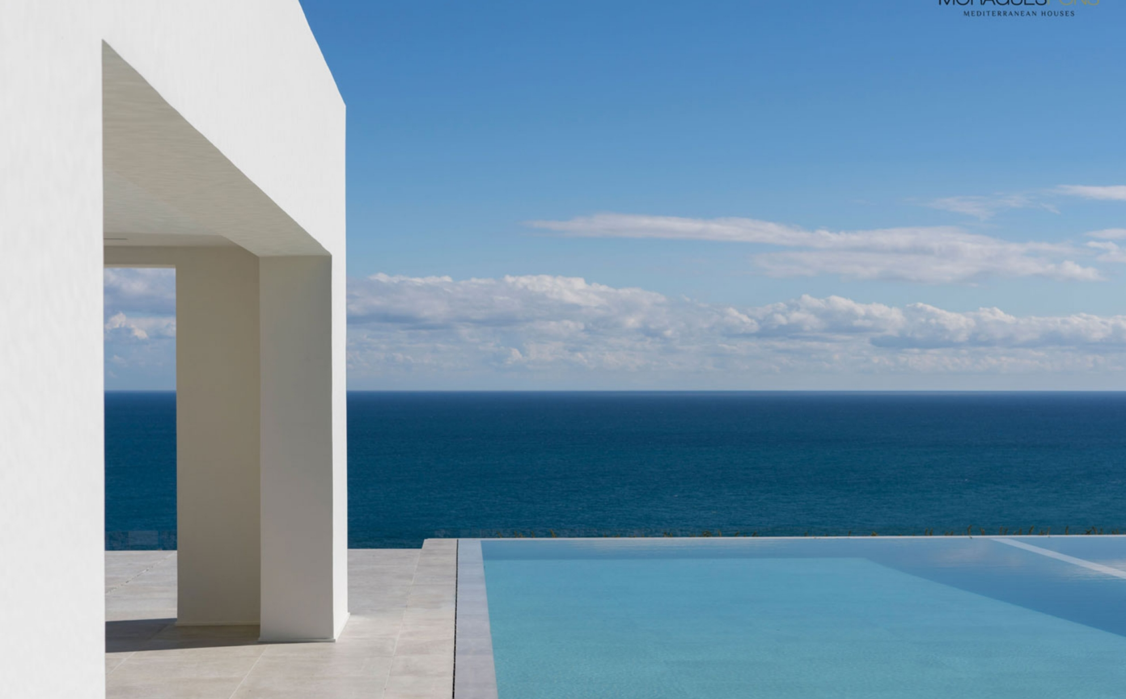
Villa de lujo de estilo mediterráneo y en primera línea de mar BALCÓN AL MAR - PORTICHOL, JÁVEA/XÀBIA - REF. V-469