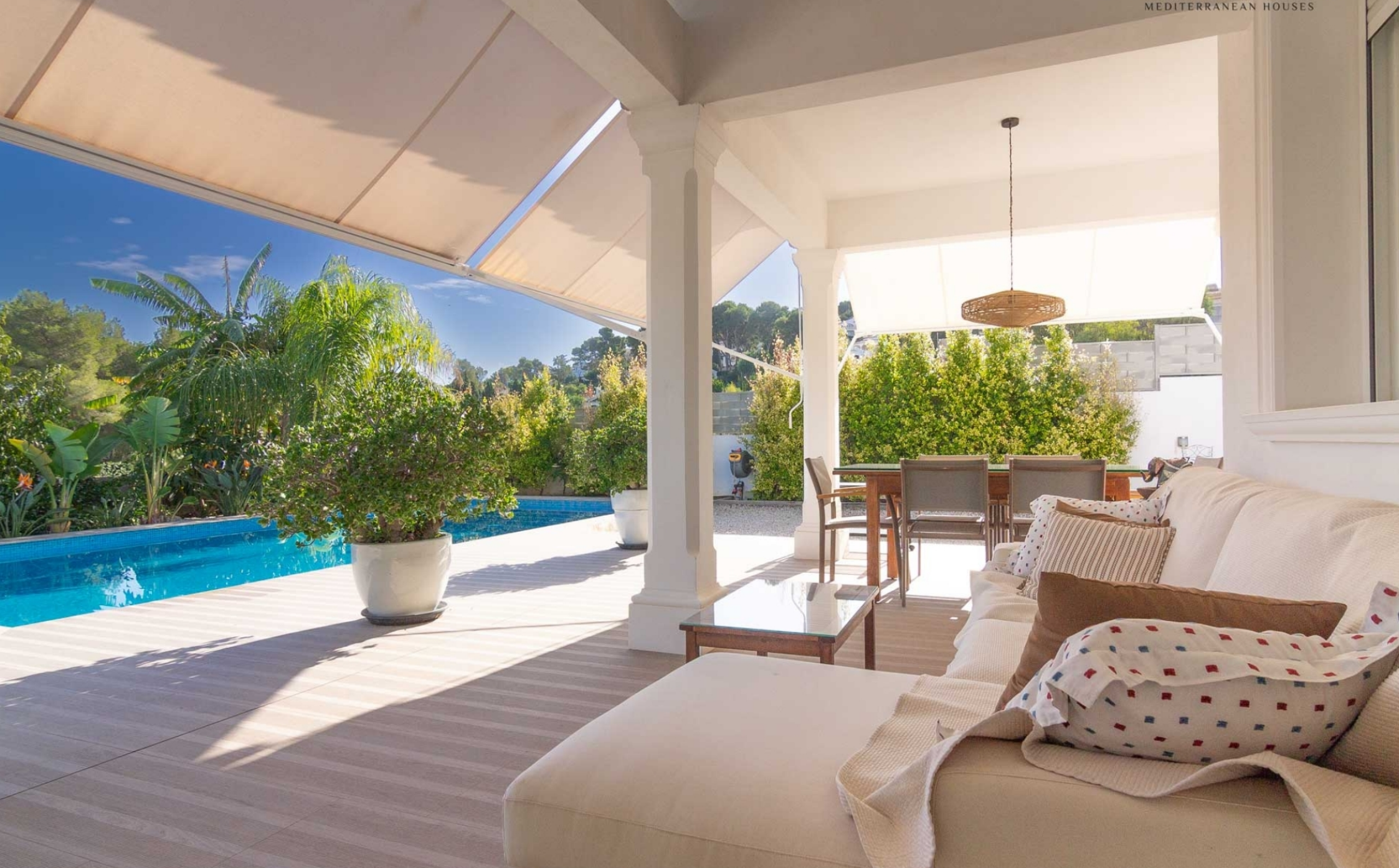
Villa de reciente construcción en Pinosol , Jávea CAP MARTÍ - PINOMAR, JÁVEA/XÀBIA - REF. V-437