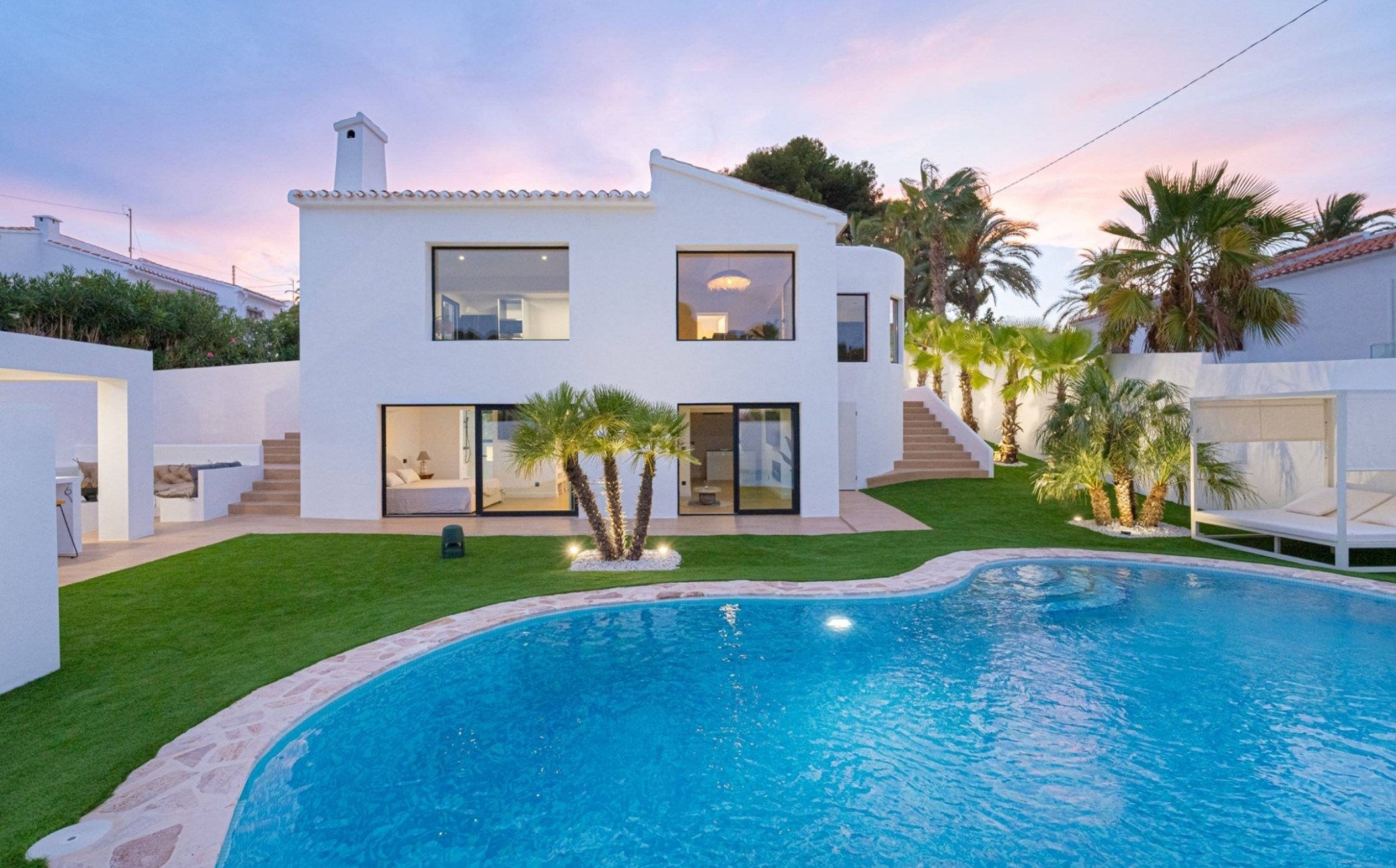
Villa totalmente reformada junto la playa del arenal de Jávea CAP MARTÍ - PINOMAR, JÁVEA/XÀBIA - REF. V-503