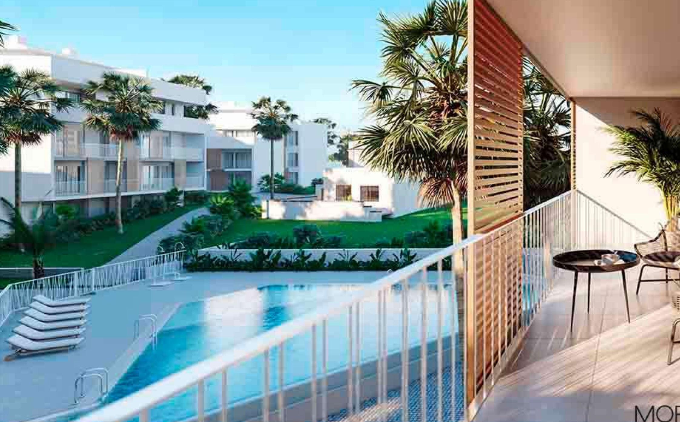
Vivienda en planta primera de la Promoción UNIC Jávea CENTRO CIUDAD, JÁVEA/XÀBIA - REF. UNIC 231G